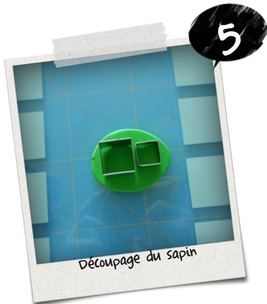
Découpage du sapin

Une fois les pâtes ramollies je vais les aplatir à l'aide du rouleau, il faut garder une épaisseur d'environ 2 mm. On fait cela pour les 2 pâtes vertes et la pâte jaune uniquement.