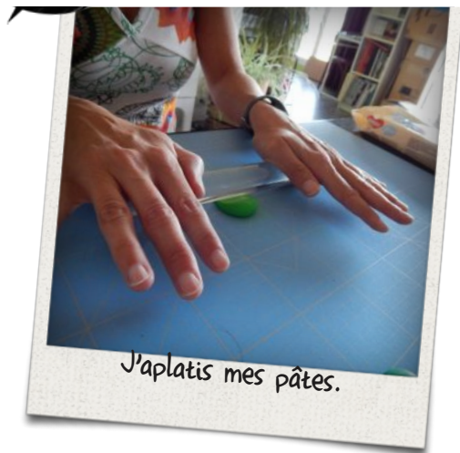
J'aplatis mes pâtes.

Une fois les pâtes ramollies je vais les aplatir à l'aide du rouleau, il faut garder une épaisseur d'environ 2 mm. On fait cela pour les 2 pâtes vertes et la pâte jaune uniquement.