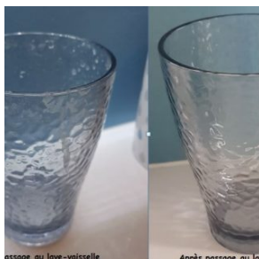
passage au lave-vaisselle