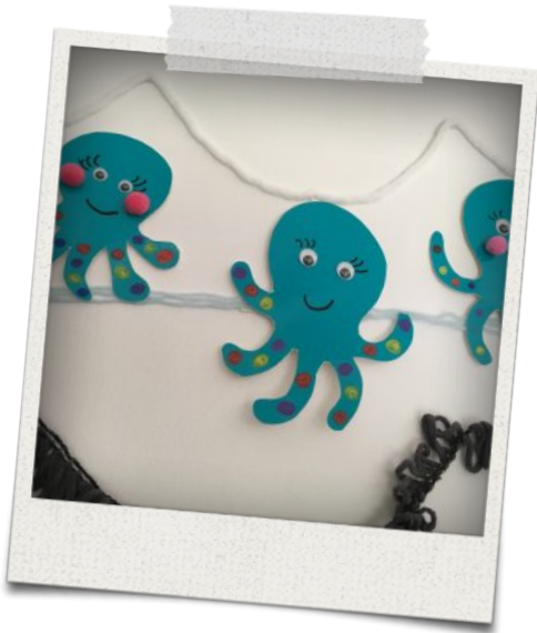
Puis j'ai tout assemblé et j'ai fait un fond avec différentes laines

Pour dénicher les dernières idées et rencontrer les passionnés, rendez vous sur zodiosphere.fr